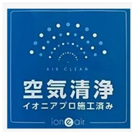
車内抗菌 施工済みステッカー