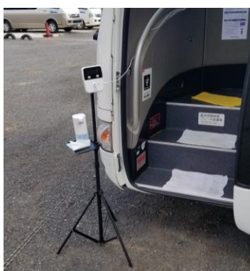
非接触 体温計・消毒装置