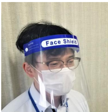
常備品 / 配布品