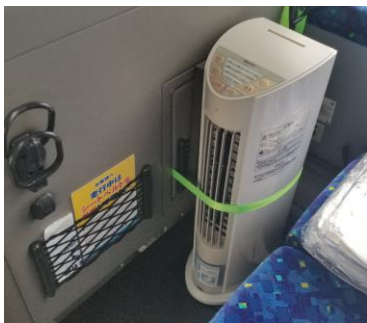
送風機 / 外気モード