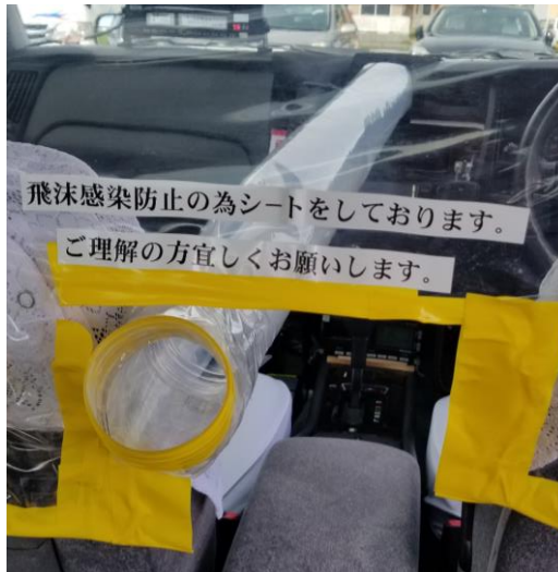
飛沫防止シート / 後部座席用送風口